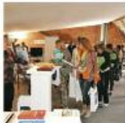
Sala SAFFO - 100 posti (PRIMO PIANO)