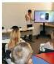
5 Aule di F (PRIMO PIANO)