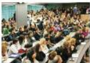
Sala AVERROE - 150 posti