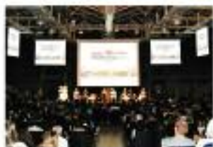
Sala NEWTON - 320 posti