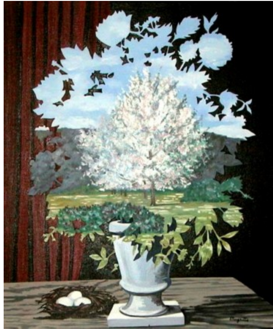
Magritte, Il plagio 1960

“ Ed è così che vediamo il mondo: lo vediamo come al di fuori di noi anche se è solo d’una rappresentazione mentale di esso che facciamo esperienza dentro di noi”.